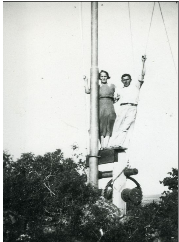
Bilder på "Kulstången".