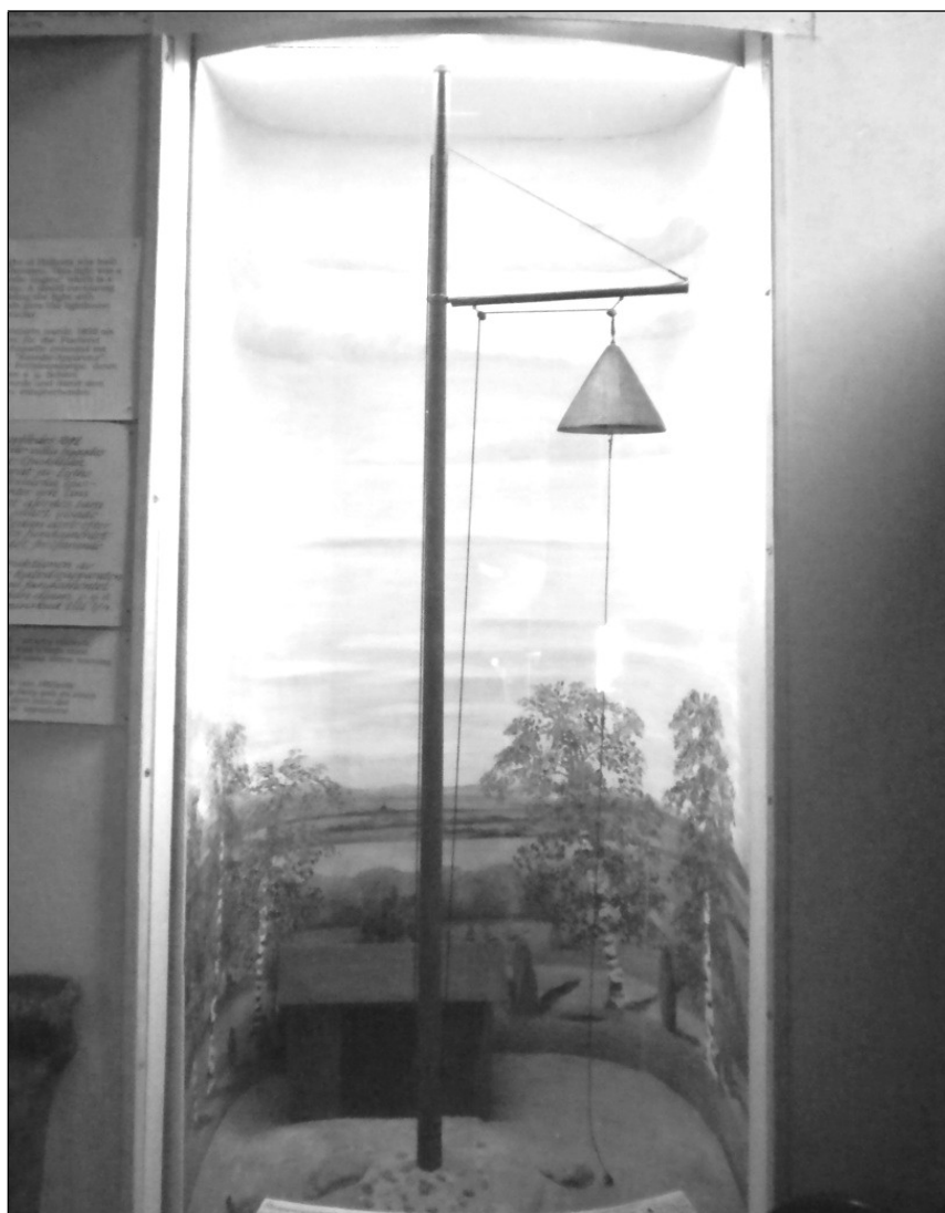
I Hälleviks fiskemuseum visas den här modellen av stormvarningssignalmast nr 45.