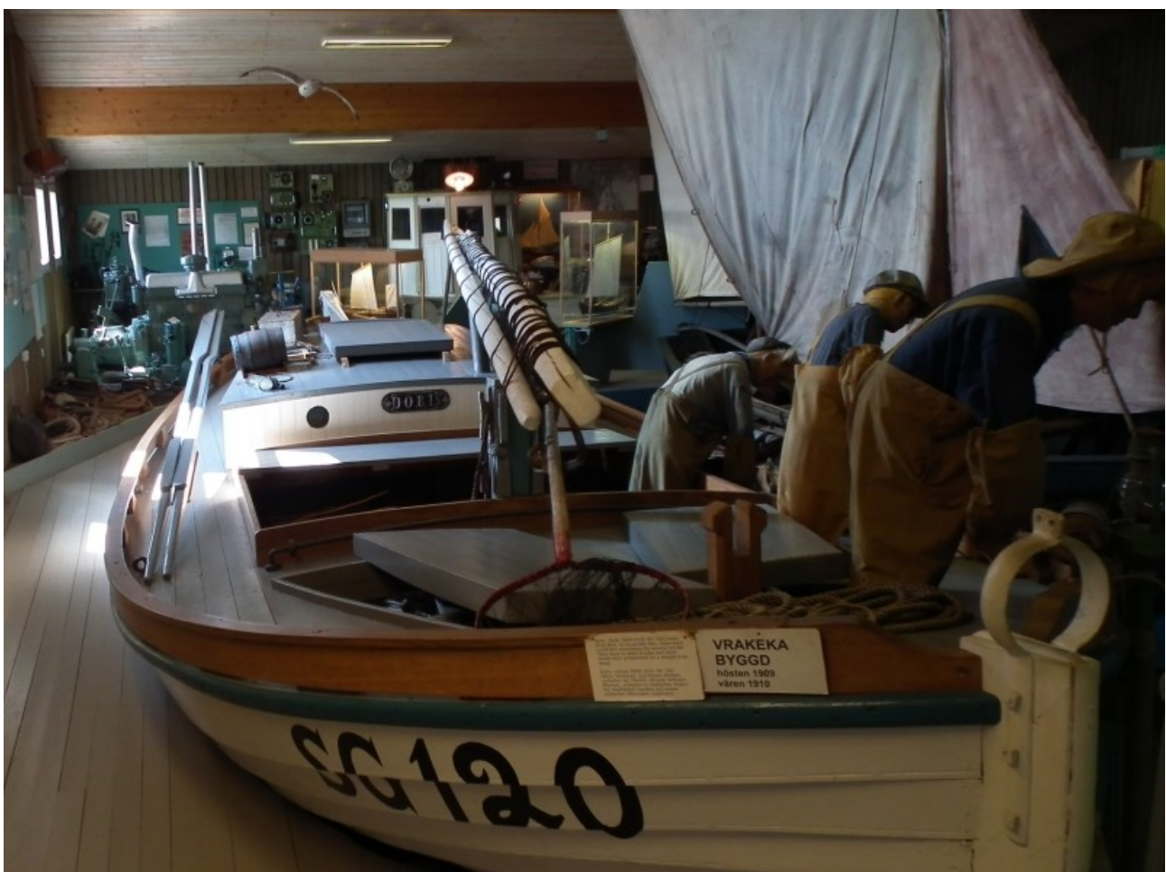
SG 120 Doris är ett av de populäraste objekten på Hälleviks fiskemuseum.

Förutom till detta drivgarnsfiske användes vrakbåtarna ofta vid fiske med laxlinor – vissa perioder i så avlägsna farvatten som längs den polska kusten.