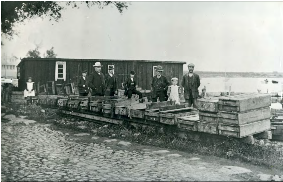
På strandsidan låg från 1890-talet ett salteri, som något av åren 1902–1905 byggdes ut med en lokal för fiskhandel till detta utseende.