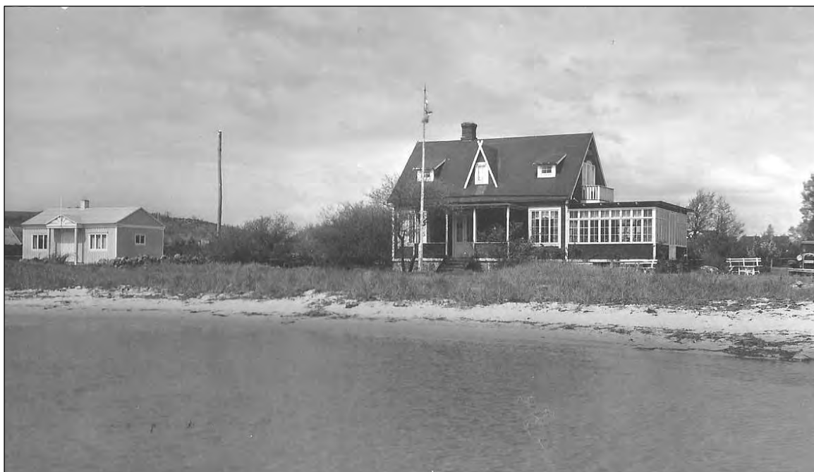
På bilden från 1940-talet ses ”Danska-kaféet” till vänster och Strandbo till höger. Efter att Strandbo förstörts vid en brand 1954 byggdes Hanöhus upp på platsen.

Hanöhus utvecklades under 1900-talets andra hälft till ett mycket populärt hotell med dansrestaurang. Tidigare dansbanor har funnits intill Haveliden uppe på Stibyberget (i början av 1900-talet) och därefter på platsen där Facklans hembygdsgård ligger.