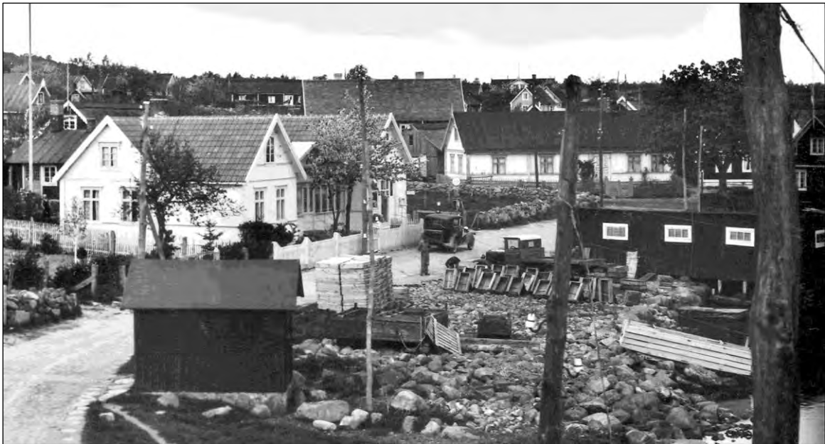
Till höger i bilden ser vi salteriet. Foto från slutet av 1930-talet.