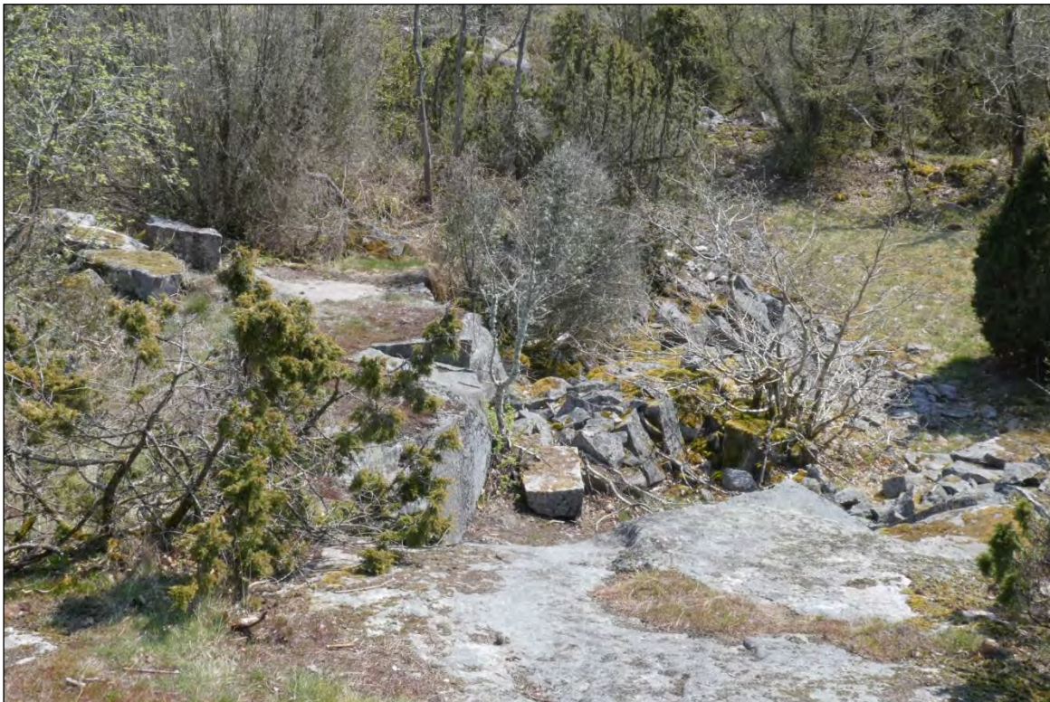
Delar av Karlshälls stenbrott sett uppifrån utsiktsplatsen på Stibyberget.