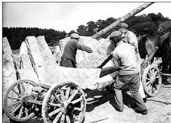
Stenbjörn med två förspända hästar. Stenblocken lastas av vid lastbryggan med hjälp av en vinsch. I bakgrunden syns andra stenblock samlade inför utskeppning. Foto från annan ort.