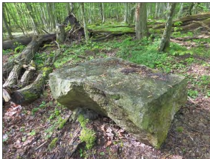
Den flata stenen framför platsen där Märserumbrottets stenhuggarbod var belägen.